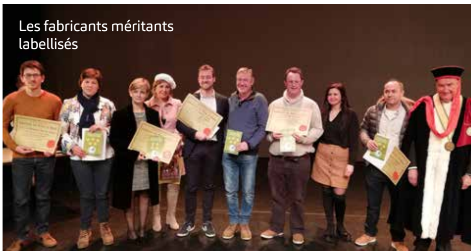
Les fabricants méritants labellisés

Retrouvez la liste des fabricants méritants labellisés sur www.djote.be !